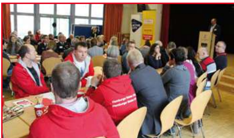
2. Senioren (Fußball): Hamburger Meister der Saison 2017/18 Verbandsliga