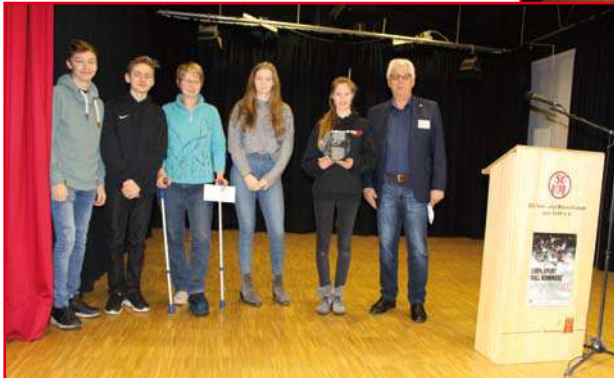
Volleyspieler: Hamburger Pokalsieger