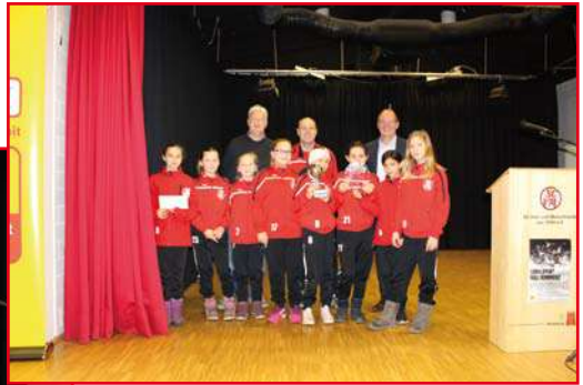
D-Jugend-Mädchen (Fußball): Hamburger Meister Hallenrunde