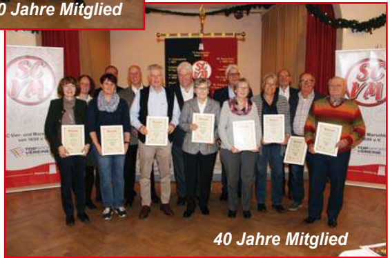
40 Jahre Mitglied